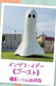
インゲス・イデー 《ゴースト》