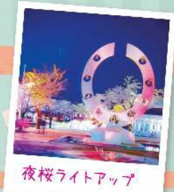
夜桜ライトアップ