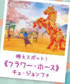
映えスポット! 《フラワー・ホース》 チェ・ジョンファ