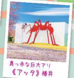
真っ赤な巨大アリ 《アッタ》権昇