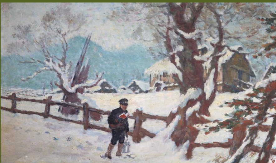
「堅蓄破雪之図」(林誓作)