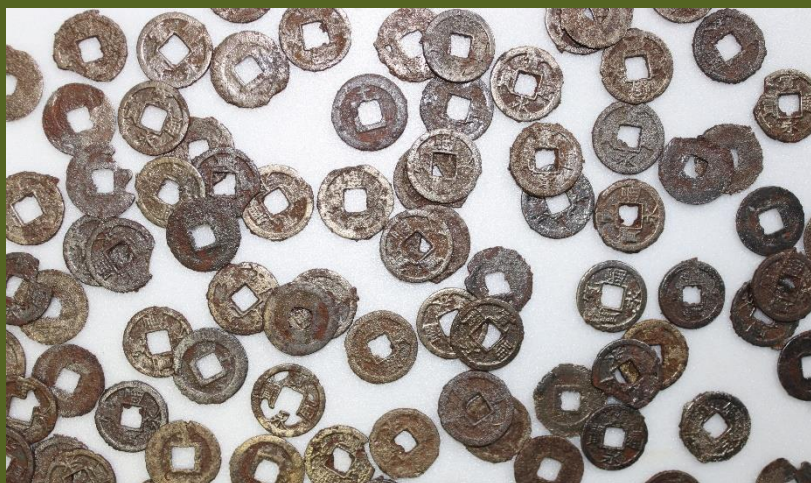
滝沢地区発見の「古銭」